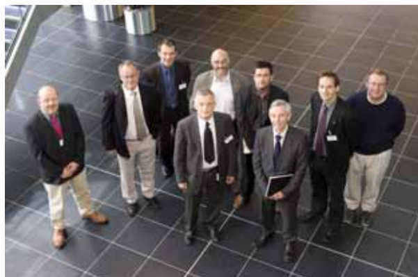
Le bureau exécutif d'Euromontana à Inverness, avec le président de Highlands and Islands Enterprise, William Roe

Les compte-rendu des réunions du bureau sont disponibles sur le site d'Euromontana, dans la section réservée aux membres.