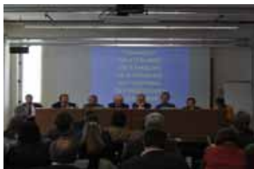
Table ronde à la conférence finale de Turin

Le projet de 3 ans Interreg IIIC « Euromountains.net » a abouti en 2007. Les conclusions générales et les recommandations ont été préparées à partir des 3 conclusions thématiques, imprimées et disséminées dans toutes les langues du projet (EN/FR/ES/PT/IT/NO) et en allemand.