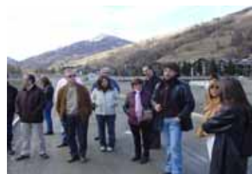
Visite d'étude de la conférence finale de Turin

Le projet a organisé sa conférence finale à Turin, Italie, les 8-9 mars. La conférence, à laquelle étaient présents plus de 150 participants de toute l'Europe, était intitulée « Collectivité territoriales et acteurs : Réussir ensemble. »