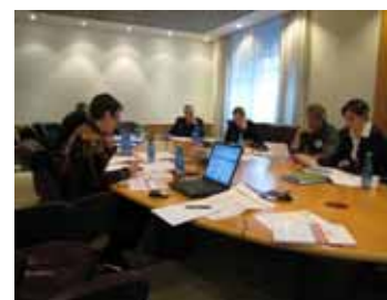
Réunion des points focaux régionaux à Rome, les 12-14 mars

Voir la section 2.5 pour davantage d'informations sur les activités du projet SARD-M.