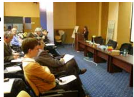
Le public pendant la présentation de Bibiana Janackova- DG Sanco, Commission européenne

Un mémorandum de la conférence a été publié en français et en anglais peu après la conférence ; un rapport en français, en anglais et en roumain a été publié (versions imprimée et électronique) et est disponible sur le site Internet d'Euromontana.