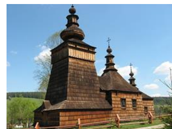
Eglise en bois en Pologne

Il est important d'accroître la visibilité des Carpates auprès des touristes européens pour rééquilibrer les flux touristiques et favoriser une situation gagnant-gagnant pour les pays souffrant de surtourisme et les pays à peine considérés comme des destinations de vacances potentielles. Pourtant, le potentiel touristique ne manque pas : en matière de patrimoine, la Pologne compte 15 sites inscrits sur la liste du patrimoine mondial de l'UNESCO alors que l'Autriche n'en compte que 9 (voir Statistiques sur la culture - édition 2019 ) ; l'attractivité repose donc sur la visibilité du patrimoine rural de montagne, comme les châteaux et les églises en bois.