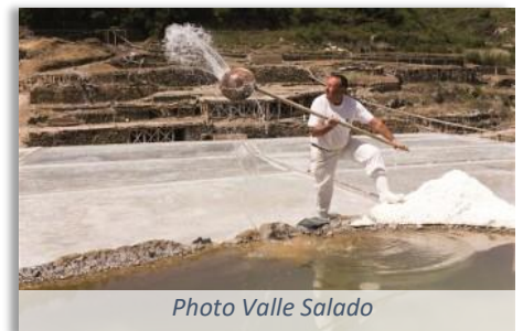
Photo Valle Salado