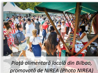
Piață alimentară locală din Bilbao, promovată de NIREA

În ultimul rând, NIREA acționează ca o vitrină a tuturor activităților și proiectelor născute în cadrul programului. Ei transmit valorile sectorului primar din mediile rurale și de coastă din Țara Bascilor. Una dintre activitățile desfășurate de NIREA a fost promovarea unei piețe de produse locale din Bilbao, numită "Gure Lurreko Merkatura". Din cauza vizibilității sale limitate, piața a concurat cu alte evenimente din oraș și nu a putut avea loc în fiecare sâmbătă. Cu toate acestea, NIREA contribuie la menținerea unui spațiu alocat pentru piața alimentară locală, chiar și atunci când mari evenimente au loc în oraș. Astfel, în timpul carnavalului din 2018, fermierilor locali li s-a permis să organizeze piața pe cel mai aglomerat bulevard al orașului, unde au întâlnit un număr uriaș de vizitatori. NIREA promovează astfel, produsele locale din mediul rural și lucrează pentru a crește cererea și consumul acestor produse. Această valorificare a produselor locale, îmbunătățește sustenabilitatea fermelor rurale, crește valoarea producătorilor și creează noi oportunități de afaceri în zonele rurale.