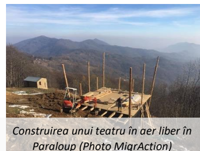
Construirea unui teatru în aer liber în Paraloup

Partenerii proiectului lucrează în momentul de față la o hartă detaliată cu rutele de migrație "Harta circuit Migracard" care va fi gata până în 2019.